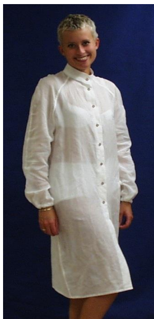
Mod. 240 med krage, raglanärm