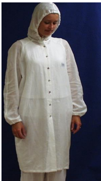
Mod.241 med kapuschong, raglanärm